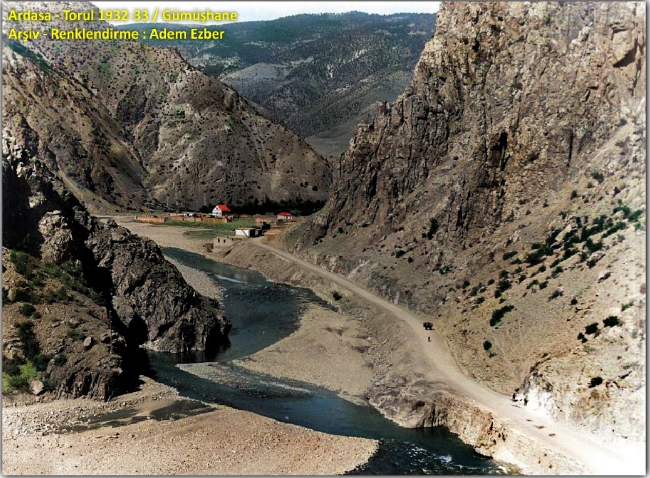
Ardasa - Torul 1932-33 / Gümüşhane Arşiv - Renklendirme : Adem Ezber