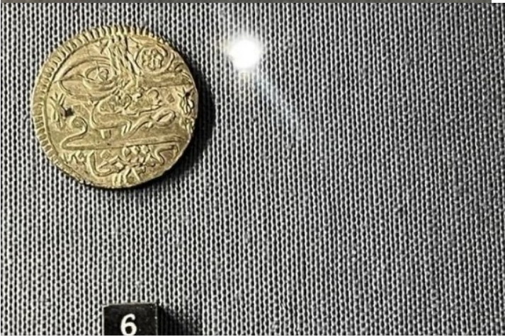
6 I. Mahmud/Mahmud I 20 Para Gümüşhane/Gumushhane 1143 (1730) Gümüş/Silver, 12.95 gr, 29-30 mm