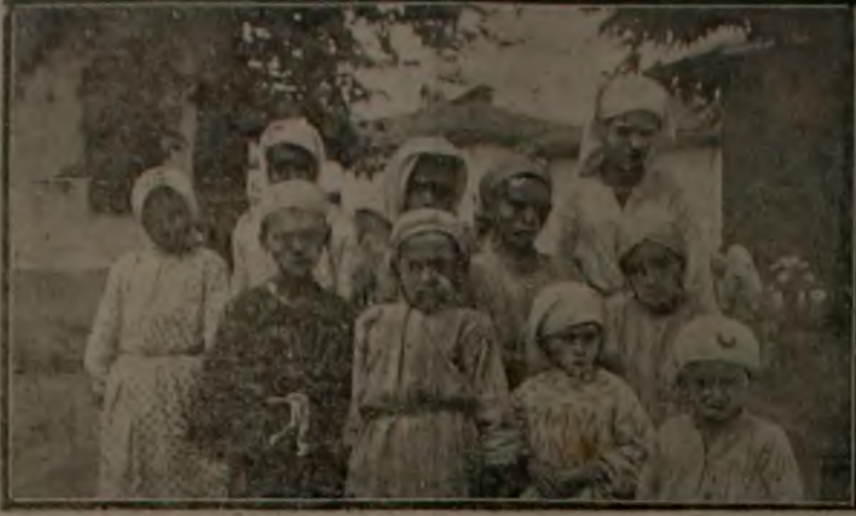
طربزونده دارالاي نامه آلان مهاجر چوجقلىرىك حالى

ههول امر طربزون امداد صمى ههئنده كان ايلىك راپور