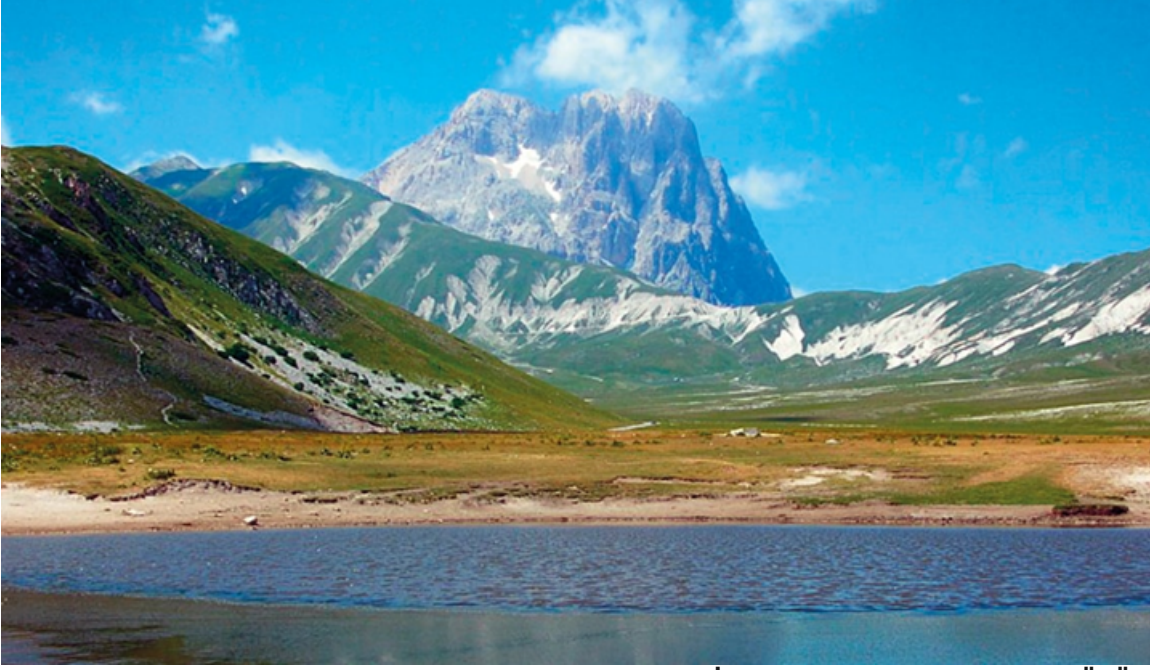
GREATER ADRIA'NIN MİRASI GRAN SASSO BUZ GÖLÜ /İTALYA

Halen Avrupa'nın altında kayıp bir kıta olan Greater Adria kıtası, çarpışma sonucunda ortadan yok olunca geriye kalan İtalya'daki Gran Sasso'daki gibi halen yeryüzünde günümüze kadar gelen buzul göllerini miras olarak bırakmıştı. Greater Adria kıtasından günümüze kalan tortul kayaçları Apenin Dağları, Alpler, Hırvatistan, Yunanistan ve Türkiye'nin dağ kuşaklarını oluşturur.