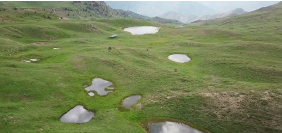
EDİRE GÖLLERİ (DÖRTKONAK KÖYÜ)/GÜMÜŞHANE

Anadolu yer ve topografik özellikleri nedeniyle arkeolojik olarak Paleolitik Çağ'a tekabül eden Pleyistosen dönemde buzullaşmaya başlamışken Gümüşhane'nin Edire Köyü 'ndeki doğal göllerin Eosen jeolojik dönemine ait granitik kayaç olarak tarihlenen Gözeler (Tenbeda) Graniti 'nin içinde bulunduğu araştırmalar sonucunda belirlenmiştir.