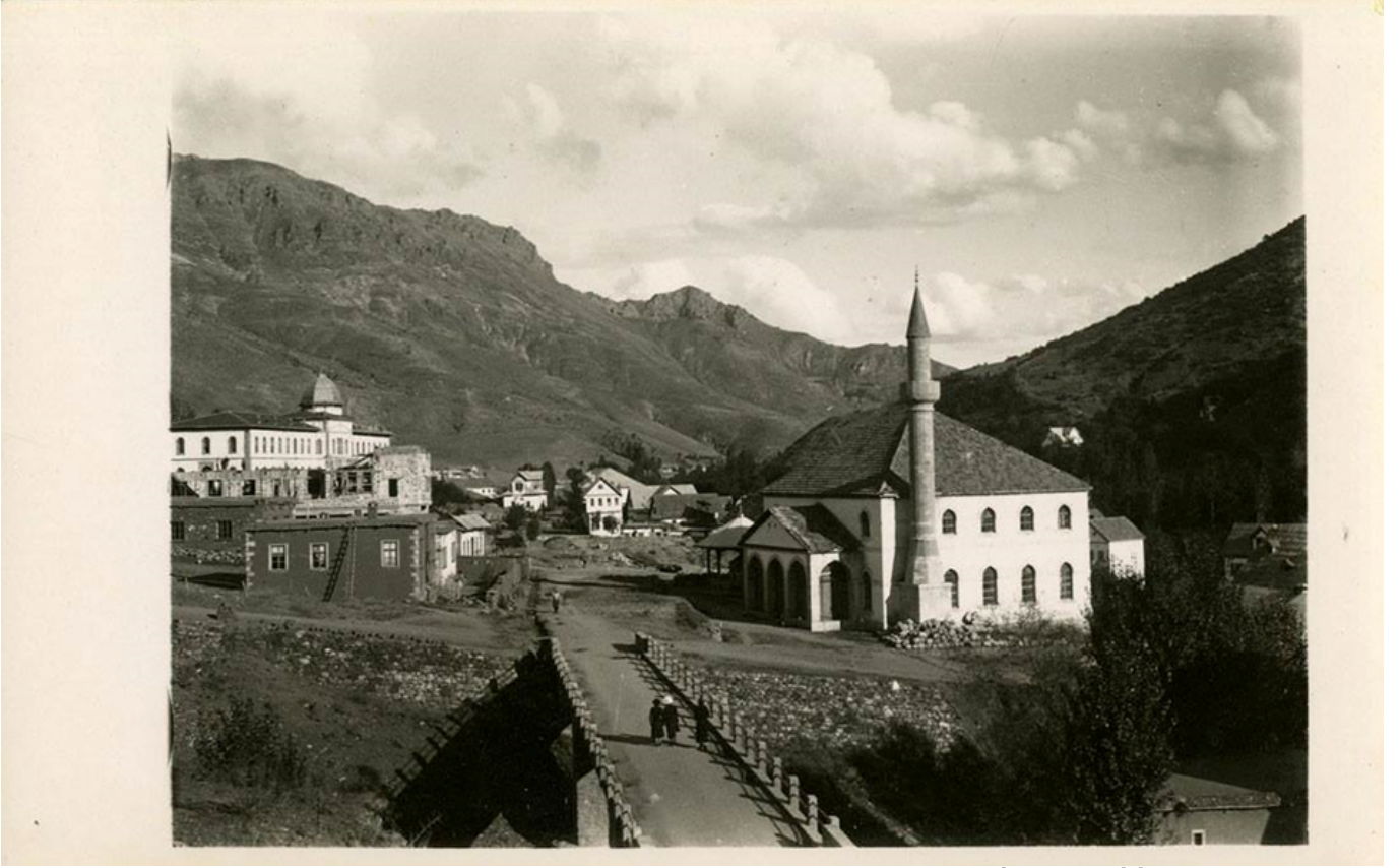
KEMALİYE CAMİİ (1922-1927)

'müezzinler', öncülüğünde caminin sobasınının yakılmasına yardım etmek her bayram namazında namaz başlamadan önce gençler için asli bir görev olarak bilinirdi. [1]