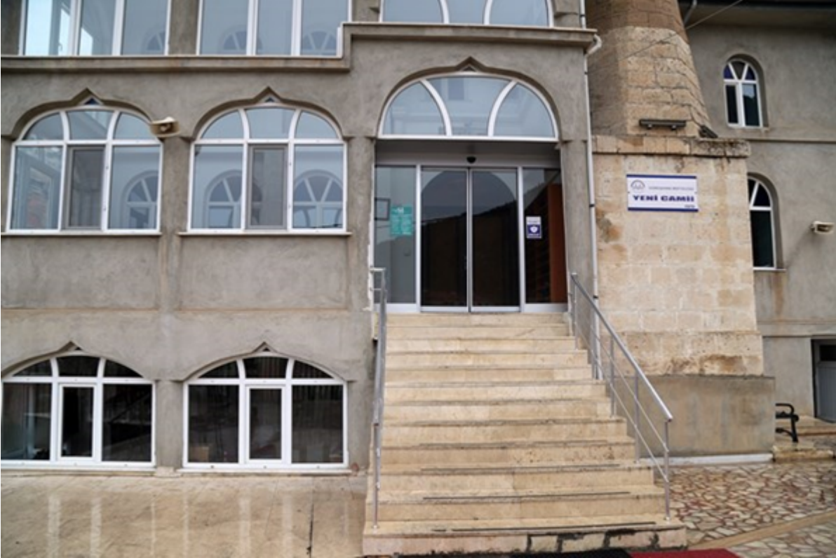
MORDUT CAMİİ (YENİ CAMİİ-1968)

Döşeme ve tavanları ahşap kâgir olarak inşa edilen hemen yanında pazarların kurulduğu ve Milli bayramların törenlerinin yapıldığı alanın yanındaki Kemaliye Camii, soğuk bir kış günü çıkan çok büyük bir yangın sonucunda 1970 li yıllarda tamamen yandığına şahit olunmuştu. Aynı arazi üzerine yenisinin inşa edilmesi ise çok uzun sürmemişti.