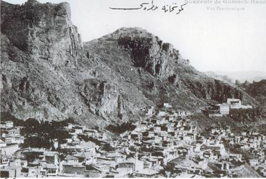
GÜMÜŞHANE 1910 [3]