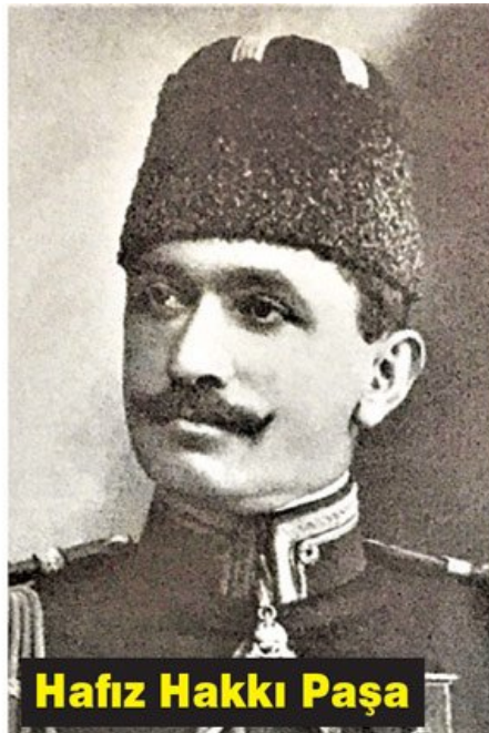
Hafız Hakkı Paşa