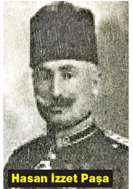
Hasan İzzet Paşa